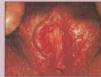
মহিলাদের যৌনবাহিত রোগের লক্ষণ