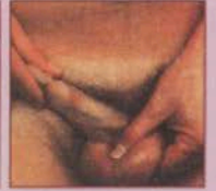
পুরুষদের যৌনবাহিত রোগের লক্ষণ